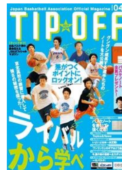
<TIPOFF 第 4 号>